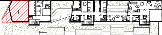
Plan de repérage

Local de proximité Etage: RDC Type: Artisanat